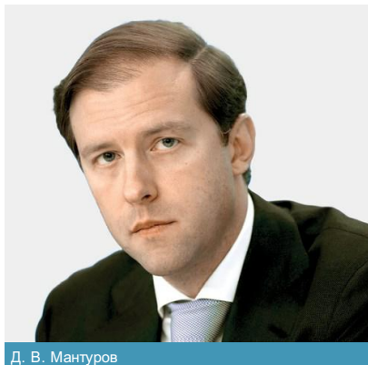
Д. В. Мантуров

В 2015 году акционерное общество «Объединенная судостроительная корпорация» продолжило работу по исполнению своей роли в решении приоритетных задач государства в сфере экономики, промышленности, национальной безопасности. Новые макроэкономические вызовы, с которыми столкнулась российская судостроительная отрасль, были в значительной мере компенсированы системной работой, направленной на повышение эффективности ОСК.